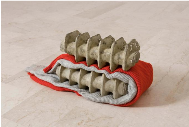
Figura 14. The same heat 2018 / concrete, pigments, jumpers / 36x93x52 cm 14