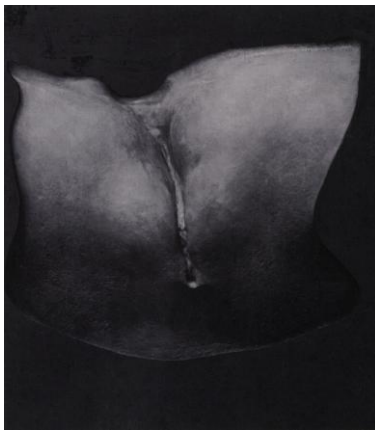
Figura 4. 5

En 1956 Marcel Duchamp presenta la obra hoja de parra femenina, para el diseño de la portada de la revista de arte Le Surréalisme, même, no. 1 .