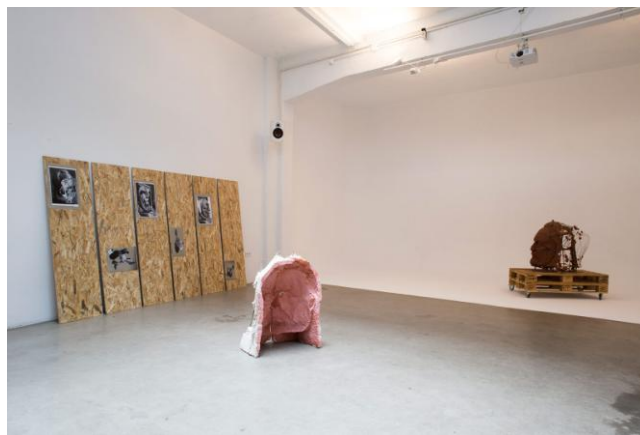
Figura 10. Mario Espliego, (2019) Molienda . 10

En 2019 el artista Mario Espliego nos muestra molienda con este trabajo quiere reflexionar acerca de un busto realizado por el escultor Emiliano Barral en el año 1933 en memoria del líder socialista Pablo Iglesias, en esta fecha se realizó un proyecto conmemorativo que incluye un relieve, murales y un busto de un metro de altura, el monumento se inauguró en mayo de 1936 y fue construido en el paseo de Camoens junto al Parque del Oeste en el Parque del Oeste. El conjunto aguantó en pie, hasta el final de la guerra pero fue destruido por el bando sublevado. Con los materiales de su derribo fueron trasladados al Parque del Retiro para realizar el muro que rodea este lugar, unos operarios reconocieron el gusto de Pablo Iglesias y lo enterraron ocultando su ubicación hasta entrar en democracia, el busto original, actualmente se encuentra en la sede del Partido Socialista.