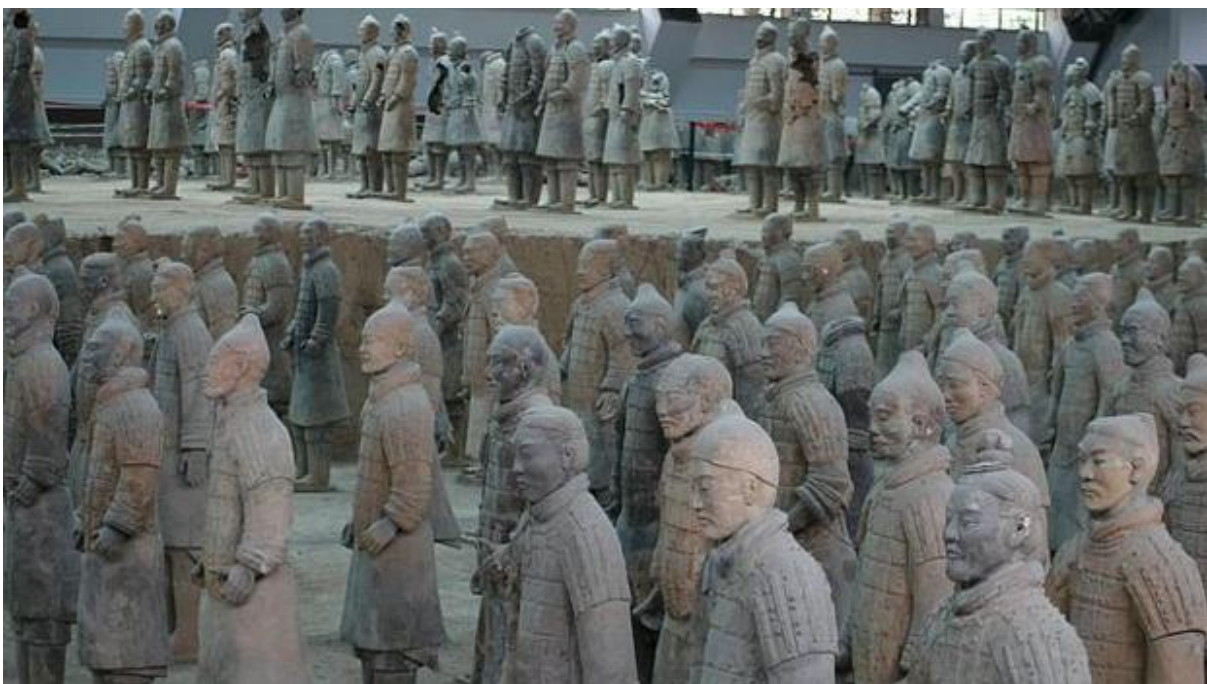
Figura 14. Museo del conjunto arqueológico de los Guerreros de Terracota de Xian - Pablo M. Díez. 13

En los guerreros de terracota de Xian del año 210 a 209 antes de Cristo, podemos ver que han sido reproducidos en masa mediante moldes los escultores le daban personalidad añadiendo detalles como bigote orejas barba, diferentes brazos una vez colocadas juntas todas las esculturas parece un auténtico ejército con más de 8000 piezas.