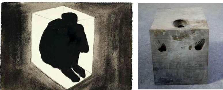
Figura 12-13. Antony Antony Gormley, (1991) Sense . 12

Antony Antony Gormley presenta su obra Sense en 1991 donde representa al ser humano mediante la ausencia del del mismo. El artista utiliza un molde de cera de su propio cuerpo y vacía cemento sobre el mismo posteriormente derritiendo la cera, el resultado es inquietante, a través del bloque de cemento se dejan ver en espacio que ocuparían las manos o la cabeza.