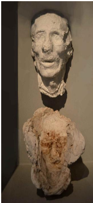
Figura 1. Molde en yeso, Museo Arqueológico de Tesalónica. 2

En el Museo Arqueológico de Tesalónica se encuentra un molde en yeso datado al siglo III a.C, poco tiempo después de la de Lisítrato, citada por Plinio el Viejo.