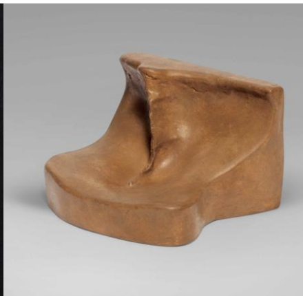
Figura 5. 6