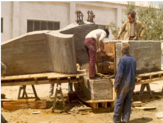
Figura 11. E. Chillida, (1972) Lugar de encuentros III . 11

En la obra de Eduardo Chillida Lugar de encuentros III de 1972, Podemos ver el proceso de realización de este trabajo mediante la utilización de un encofrado Trabajando con el espacio que va ocupar la obra final.