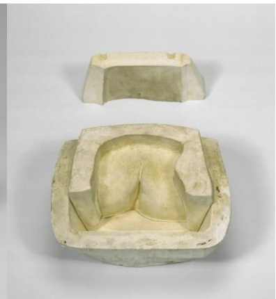
Figura 6. 7

La obra, fue realizada mediante un molde en yeso, El artista juega con el positivo y el negativo de la reproducción de una vagina femenina, Inspirándose claramente en la obra de Courbet el origen del mundo de 1866, el molde pasa en cierto modo a ser tratado como obra de arte.