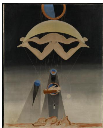
Fig. 10: Los hombres sabrán nada de esto, 1923, Max Ernst.