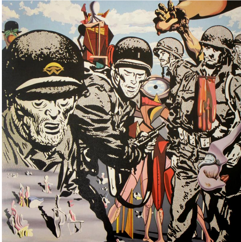
Fig. 1: Los soldados de Bretón, 1971, Equipo Crónica.