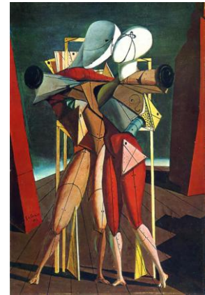
Fig. 5 (izquierda): Un canto de amor, 1914, Giorgio de Chirico.