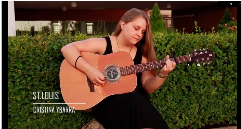
Ilustración 3. Fotograma del documental "Cantautoras". Enlace del vídeo https://vimeo.com/357748524