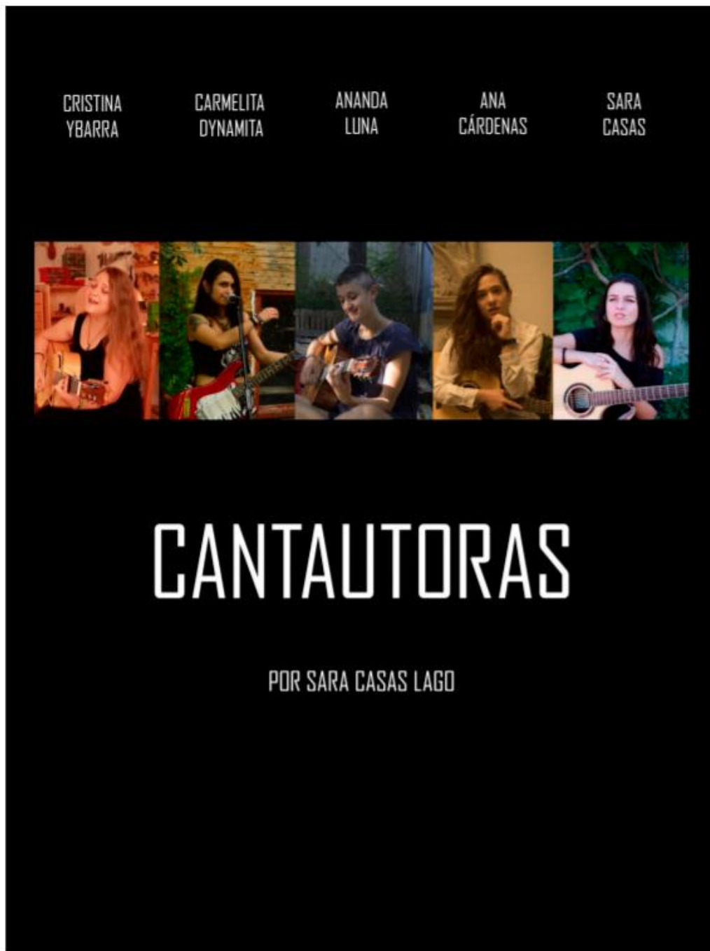
Ilustración 2. Cartel Promocional del documental "Cantautoras"