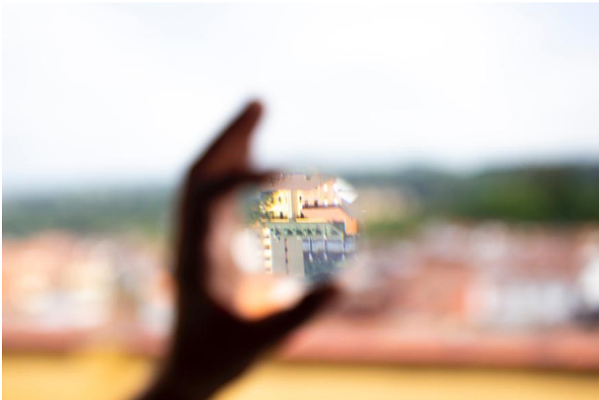
Figura 1. Título Visual. Autora (2020). Filtrar .

https://dx.doi.org/10.48260/ralf.extra1.68