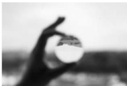
Figura 2. Autora (2020). Filtrar . FOTOENSAYO compuesto por dos fotografías de la autora, arriba Acercar (2019), y abajo En foco (2019)