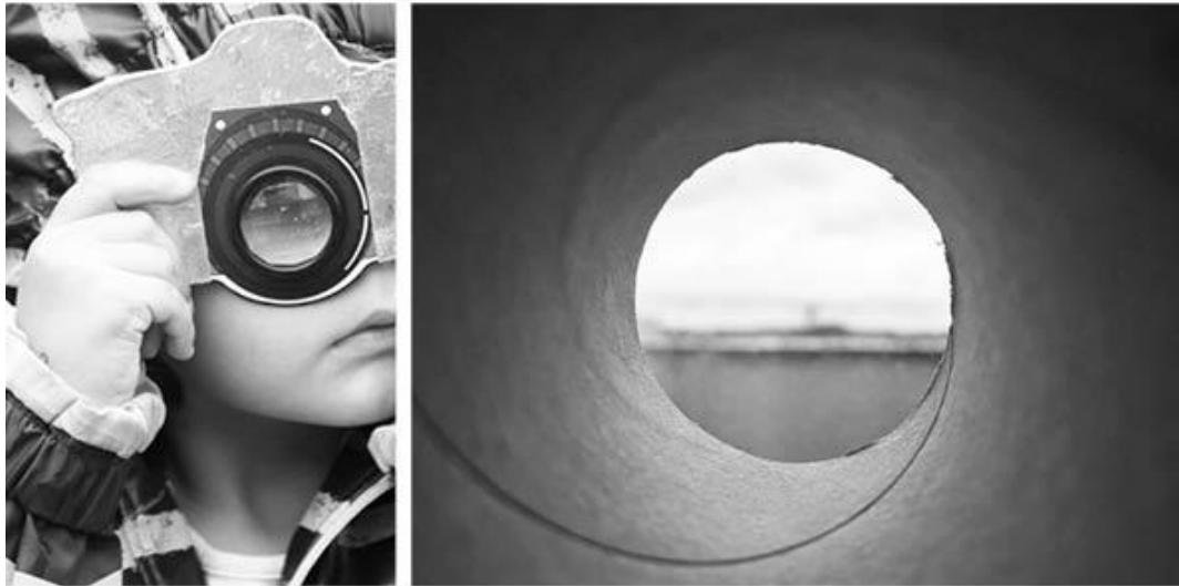
Figura 3. Autora (2020). Ángulo ciego . FOTOENSAYO compuesto por dos fotografías, de Proyecto Lainopia izquierd Catalejo (2019), y de la autora derecha Mirilla (2019)