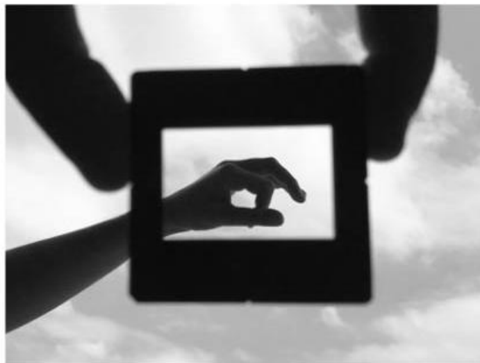
Figura 4. Autora (2020). Delimitar . FOTOENSAYO compuesto por dos fotografías de Proyecto Lainopia arriba Proyección (2018) y de la autora abajo En plano (2019)