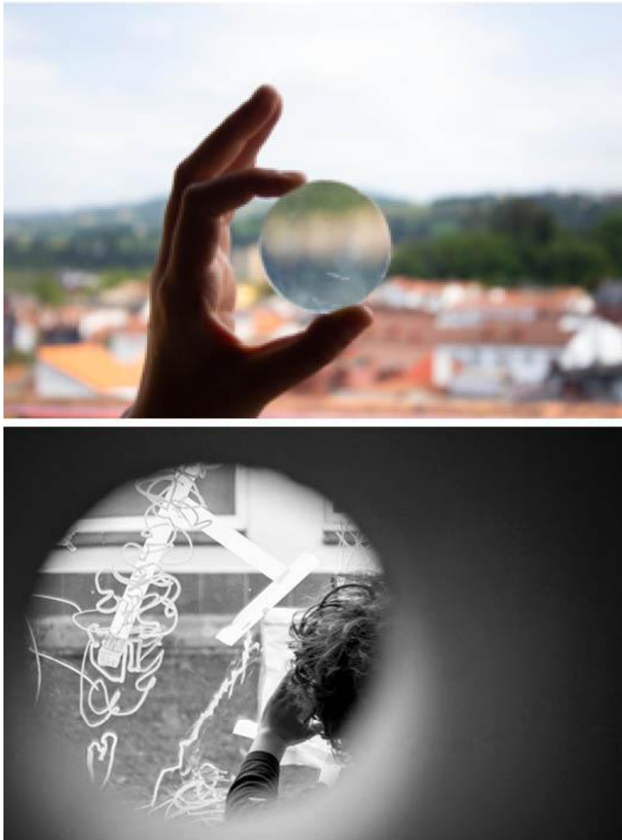
Figura 5 . Autora (2020). Delimitar .

ISSN: 2659-7721 https://dx.doi.org/10.48260/ralf.extra1.68