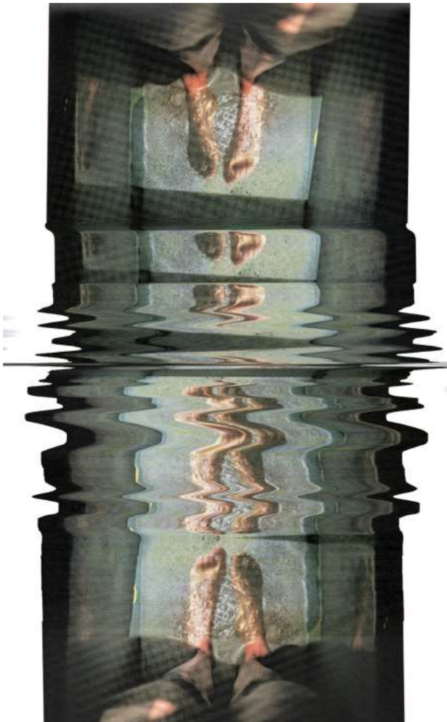
Figura 4. María Méndez-Suárez (2020) Pisada en reflejos . FotoCollage compuesto por fotografías en papel escaneadas de las autoras.