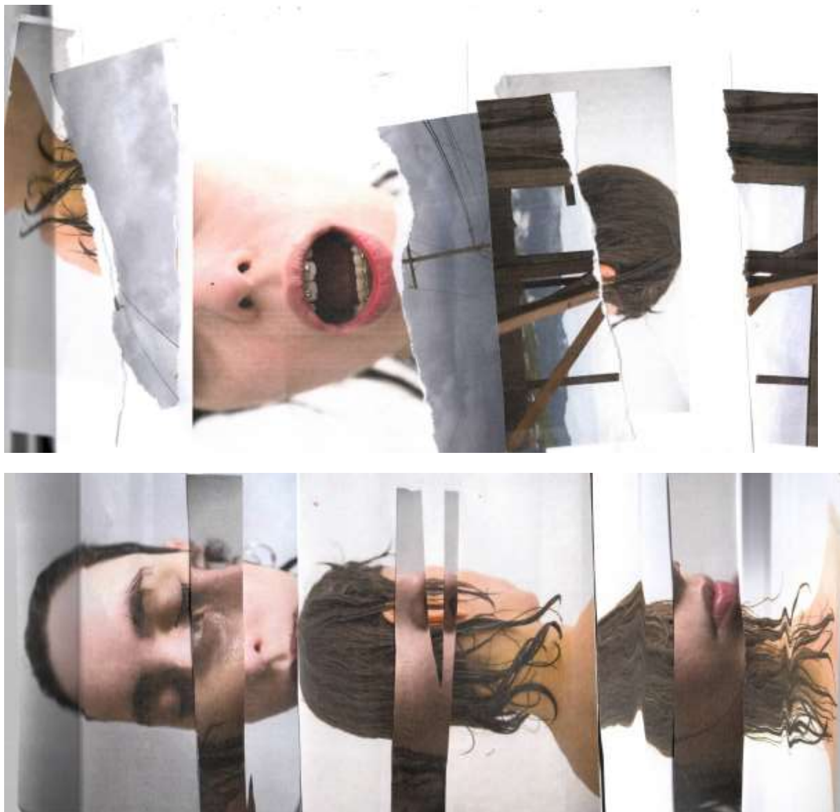
Figura 2. Alicia Arias-Camisón (2020). Variaciones del rostro deformado . Par visual compuesto por, arriba, fotocollage compuesto por fotografías en papel escaneada de Alicia Arias-Camisón (2020) Retrato Rasgado y abajo, fotocollage compuesto por fotografías en papel escaneada de Alicia Arias-Camisón (2020) Rostro en cortes .

https://dx.doi.org/10.48260/ralf.extra3.58