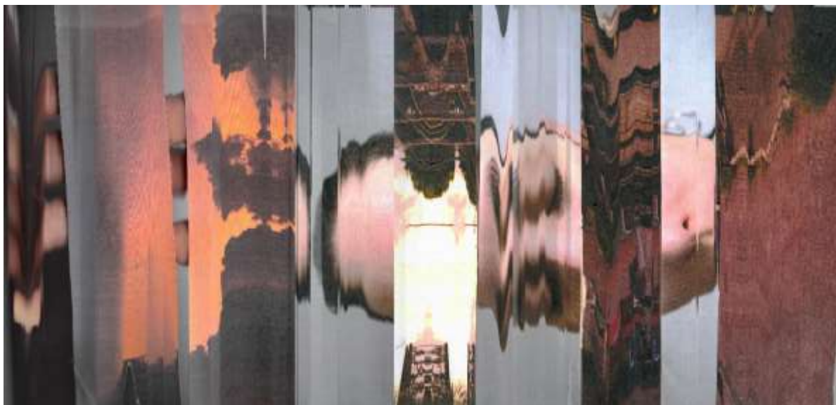
Figura 7. Alicia Arias-Camisión (2020). Te pienso a mi alrededor I . FotoCollage compuesto por fotografías en papel escaneadas de la autora.