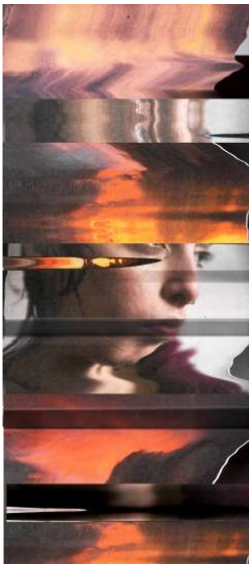
Figura 8. Alicia Arias-Camisón (2020). Te pienso a mi alrededor II . FotoCollage compuesto por fotografías en papel escaneadas de la autora

A través del recorrido visual podemos vagar por las imágenes siendo el espectador el que decide qué camino elegir. No hay una única dirección correcta, sino que se pueden explorar diversas rutas alternativas. Las imágenes se interconectan y fragmentan de un modo rizomático (Deleuze y Guattari, 1977). Caminar se entiende como navegar de un sitio a otro, concebido como un paralelismo del surfing digital que nos hace vagar de manera arbitraria y sorpresiva entre las distintas páginas y posts , derivando hacia diversas direcciones atomizadas.