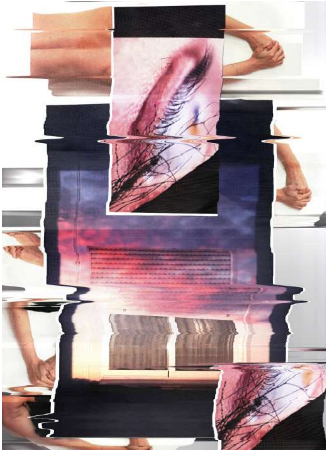
Figura 9. María Méndez-Suárez. Conclusiones visuales. Mi cuerpo y mi espacio fragmentado . Fotocollage compuesto por fotografías en papel escaneadas de las autoras