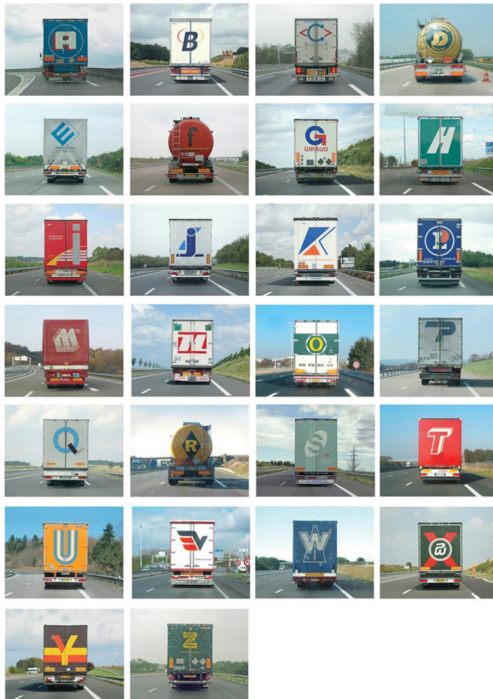
Imagen 2. Alphabet Truck (2008), de Eric Tabuchi.

Destacamos que es una colección cerrada (un alfabeto completo) con un alto contenido visual y una realización condicionada por la adopción de criterios (ruta y contenido iconográfico).