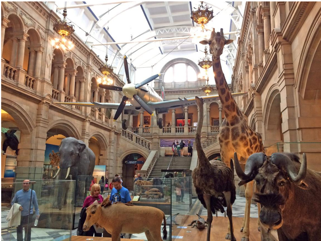
Imagen 1. Vista general de la sala principal, Kelvingrove Art Gallery and Museum.

Convertido en una de las atracciones más visitadas del Reino Unido, el Kelvingrove Art Gallery and Museum recoge más de 8000 objetos clasificados en diferentes colecciones y galerías. La contemplación en un mismo espacio de Sir John –un elefante disecado–, un avión Spitfire LA198, una escultura de Elvis Presley y el Cristo de San Juan de la Cruz , de Salvador Dalí, nos remite a los antiguos gabinetes de curiosidades y maravillas, los wunderkammer , a la vez que nos interrogamos sobre los criterios de recopilación aplicados.