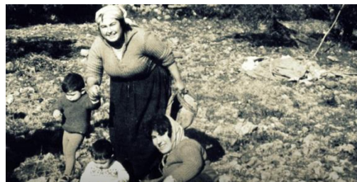
Figs. 1 y 2: “Fototeca El Chinero”, Santisteban del Puerto