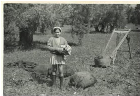
Figs. 3 y 4: Fotografías cedidas por Loli Caballero de la Torre, de su álbum familiar, Martos.