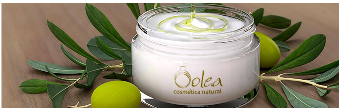
Fig. 7: Olea Cosméticos S.L.: https://oleacosmeticos.com/

Y también las mujeres han tomado iniciativas, uno de los proyectos más destacados fue Olea Cosméticos S.L. Se trataba de una empresa puesta en marcha y gestionada y desarrollada íntegramente por mujeres de Pegalar, en Jaén, dedicada a la fabricación artesanal de cosmética natural, cuyo principal ingrediente es el aceite de oliva virgen extra y ecológico, (Fig. 7).