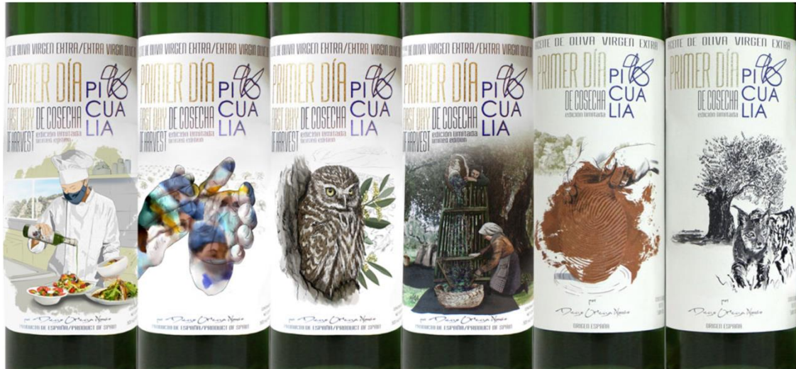
Fig. 6: Ilustraciones para las etiquetas del Primer Día de Cosecha Picualia, de izquierda a derecha, de 2021 a 2016, Diego Ortega Alonso.

Y también las mujeres han tomado iniciativas, uno de los proyectos más destacados fue Olea Cosméticos S.L. Se trataba de una empresa puesta en marcha y gestionada y desarrollada íntegramente por mujeres de Pegalar, en Jaén, dedicada a la fabricación artesanal de cosmética natural, cuyo principal ingrediente es el aceite de oliva virgen extra y ecológico, (Fig. 7).