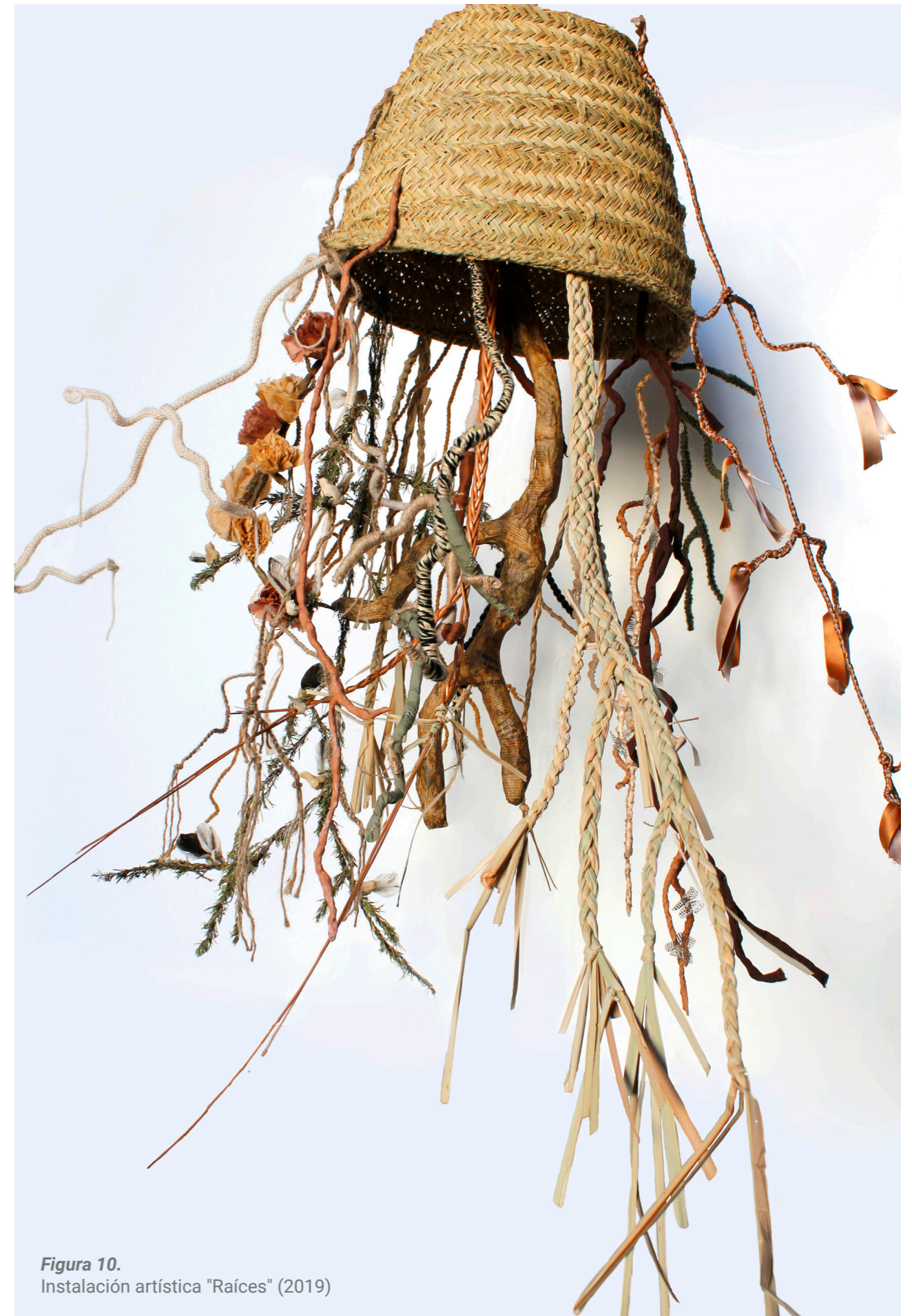
Figura 10. Instalación artística "Raíces" (2019)