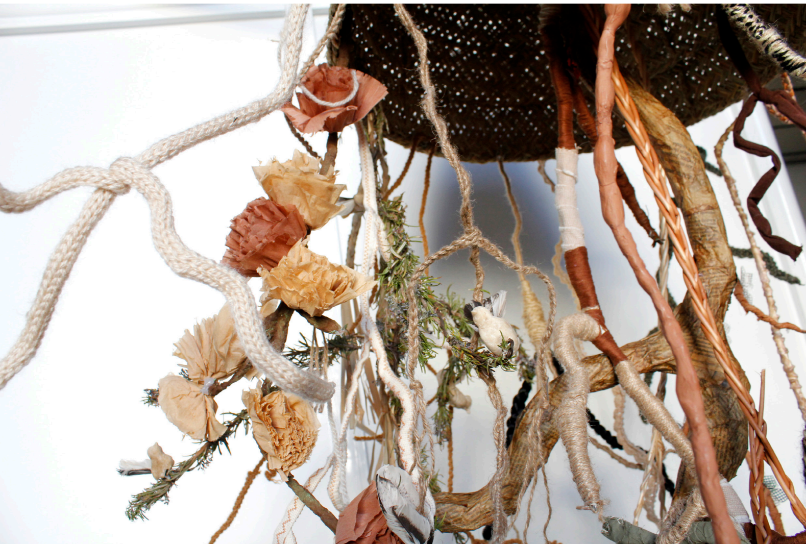
Figura 11. Instalación artística "Raíces" (2019)

Monteiro Brito, Clara. (2018). El cultivo del cuerpo femenino: la investigación de una escena videoinstalativa en la ciudad de Jaén. Tercio Creciente , 13, págs. 39-56. https://dx.doi.org/10.17561/rtc.n13.4