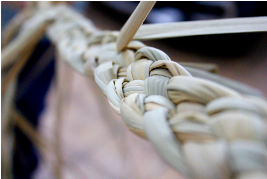
Figura 8. Raíz realizada en enea (2019)