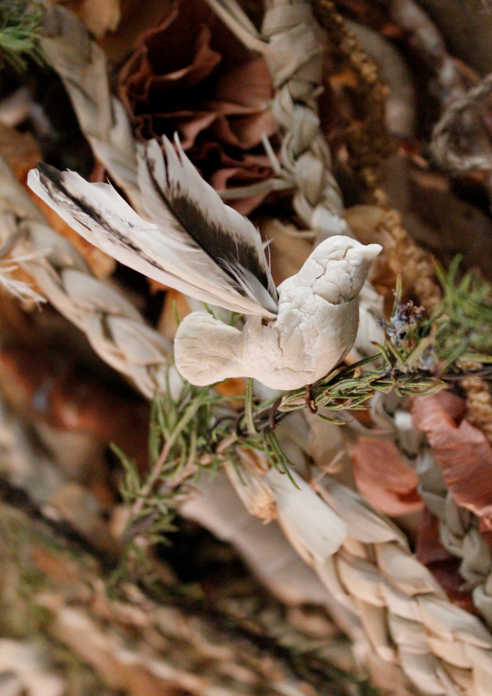
Figura 4, 5, 6, 7. Detalles de las diferentes raíces que componen la obra (2019)