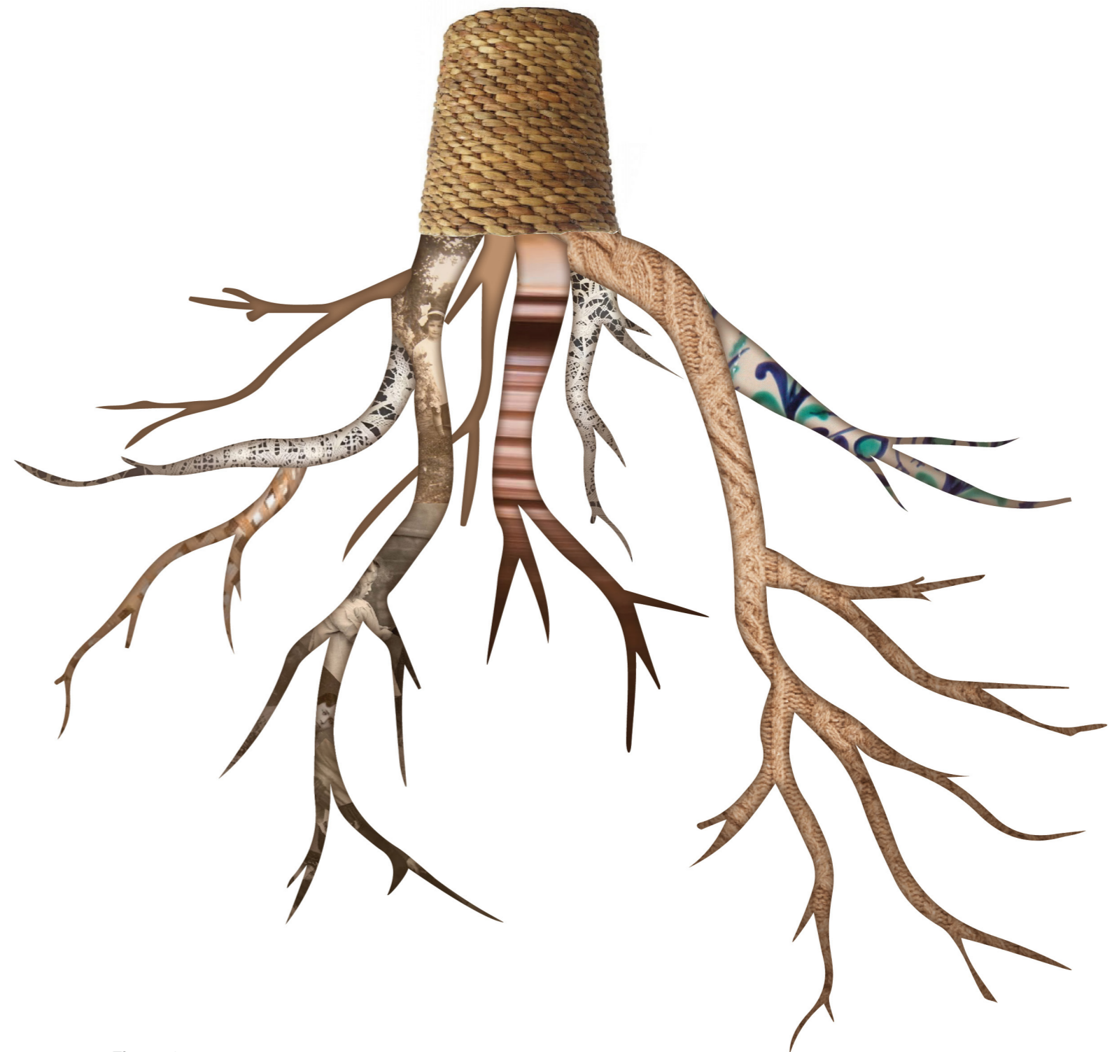
Figura 1. Boceto del proyecto. Sánchez, M a Azahara (2019)

La instalación artística “Raíces” está basada en la técnica del Ready-made, que consiste en sacar un objeto del contexto que le es habitual y situarlo en otro contexto para darle otra utilización estética.