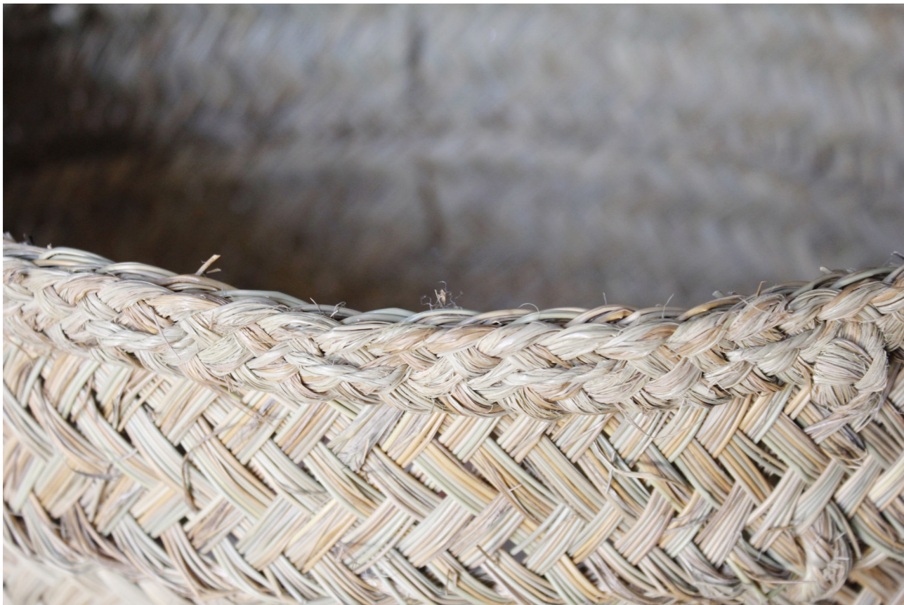
Figura 9. Cesto de esparto (2019)