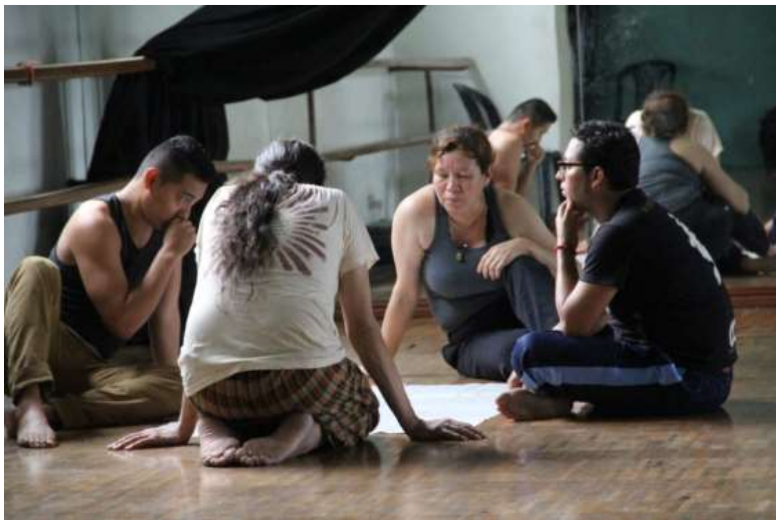
Figura 5: Talleres artísticos, Carlos Delgado Carreño, 2019. Elaboración propia