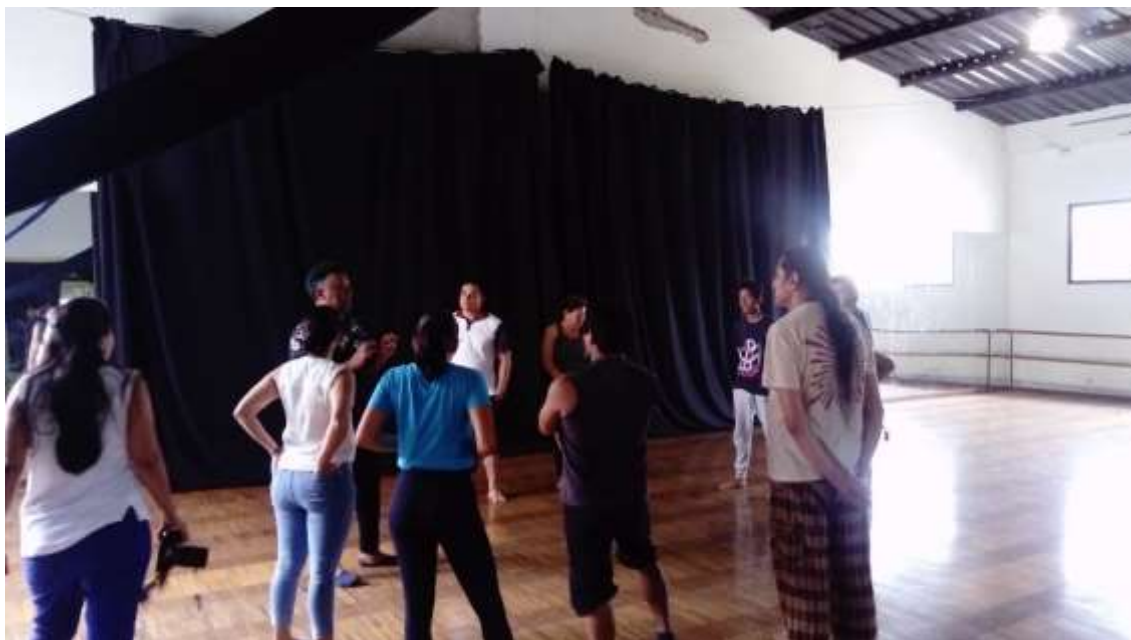
Figura 4: Talleres artísticos, Carlos Delgado Carreño, 2019. Elaboración propia