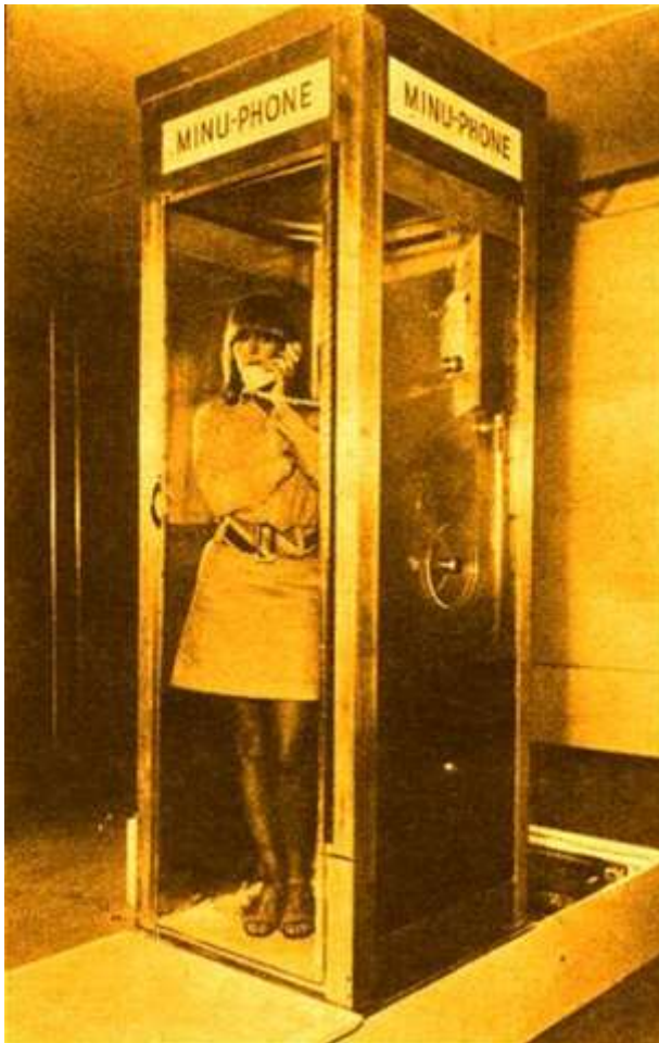
Fig. 2: Marta Minujin, Minuphone , 1967. Cabina Telefónica. Howard Wise Gallery.

De estas respuestas se obtienen datos que son claves para concienciar al espectador de cómo afectan sus acciones en el medio ambiente mundial. Como podemos leer en la presentación de la web del proyecto: “Un proyecto sobre cómo la comunicación móvil puede aportar una mejora en la comprensión problemática del medio ambiente, la sostenibilidad y el ecosistema”. Este trabajo tiene un doble sentido dentro de la misma práctica artística, por un lado la artista hace partícipe al espectador de la creación artística a la misma vez que los consciencia del impacto medioambiental que significa una acción indebida o inconsciente sobre el medio ambiente. Todo ellos es posible conocerlo gracias a cada uno de los individuos que responden a la serie de cuestiones que se les plantea en el espacio expositivo mediante la aplicación móvil.